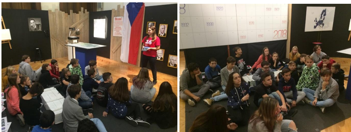
Foto č. 23 a 24: Žáci 7. ročníku při únikové hře 100 let Československa – Osudové osmičky

Své místo v plánu akcí mají také jednodenní výlety. Osmáci si zpříjemnili předvánoční čas návštěvou Techmanie v Plzni a zájemci z druhého stupně v červnu vyjeli do německého Tropical Islands. Dále pokračoval cyklus historických exkurzí, zatímco v loňském roce se jednalo o Kutnou Horu a Lidice, letos byly cílem Tábor (kam vyrazili všichni šestáci a sedmáci) a Terezín (kam jeli osmáci a deváťáci).