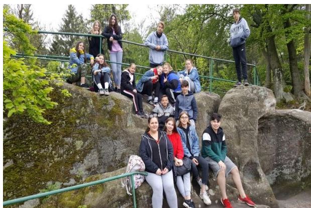
Foto č. 16. a 17.: 8. třída a 6. B na škole v přírodě v Mladějově

Již tradiční součástí začátku školního roku je týdenní studijně-poznávací pobyt v Anglii, kam jezdí zájemci z řad žáků druhého stupně. V říjnu 2018 se 26 žáků vydalo na cestu do Bournemouthu. Bydleli v hostitelských rodinách, každé dopoledne strávili v jazykové škole a odpoledne cestovali po blízkém okolí. Navštívili např. Národní motoristické muzeum v Beaulieu, zříceninu hradu Corfe Castle, slavný monument Stonehenge a přístavní město Portsmouth. Nechyběla ani celodenní prohlídka Londýna. Naše škola tento zájezd organizuje vždy ve spolupráci s cestovní kanceláří Student Agency.