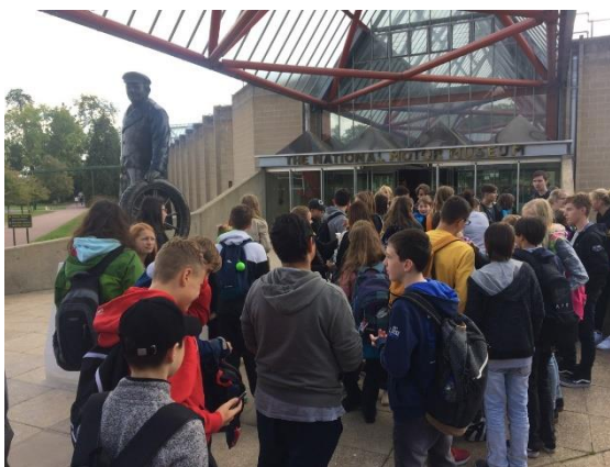
Foto č. 18. a 19.: Žáci 2. stupně na studijně-poznávacím zájezdu v Anglii