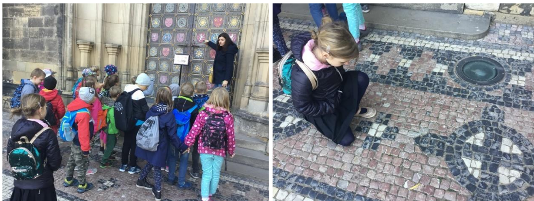
Foto č. 12 a 13: 1. projektový den „Umění kolem nás“ – 2. A na Vyšehradě

V rámci celoškolního projektu „Umění kolem nás“ navštívili žáci některé památky a zajímavá místa Prahy (Vyšehrad, Královskou cestu, náplavku) a také Národní galerii ve Veletržním paláci.