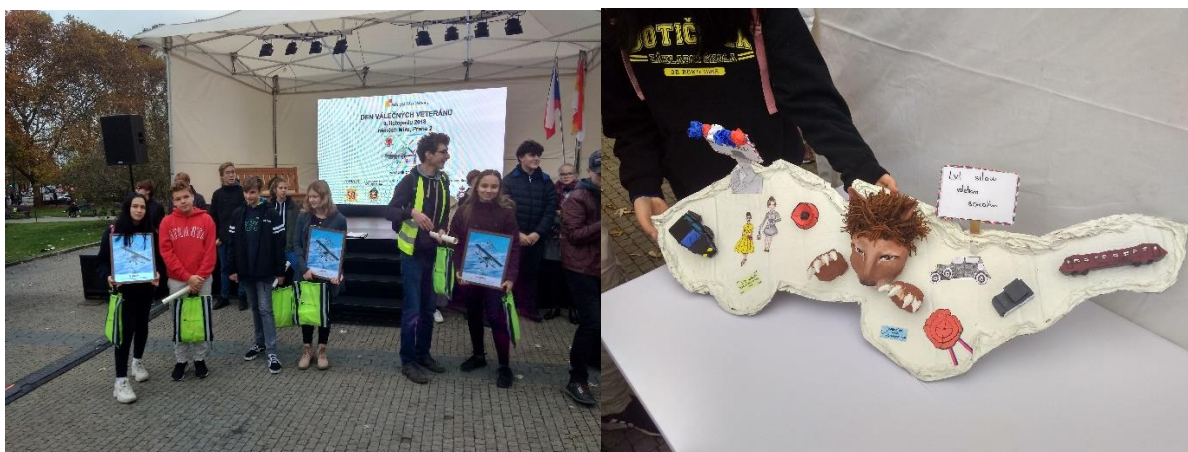
Foto č. 9 a 10: Den válečných veteránů, který každoročně připravuje MČ Praha 2